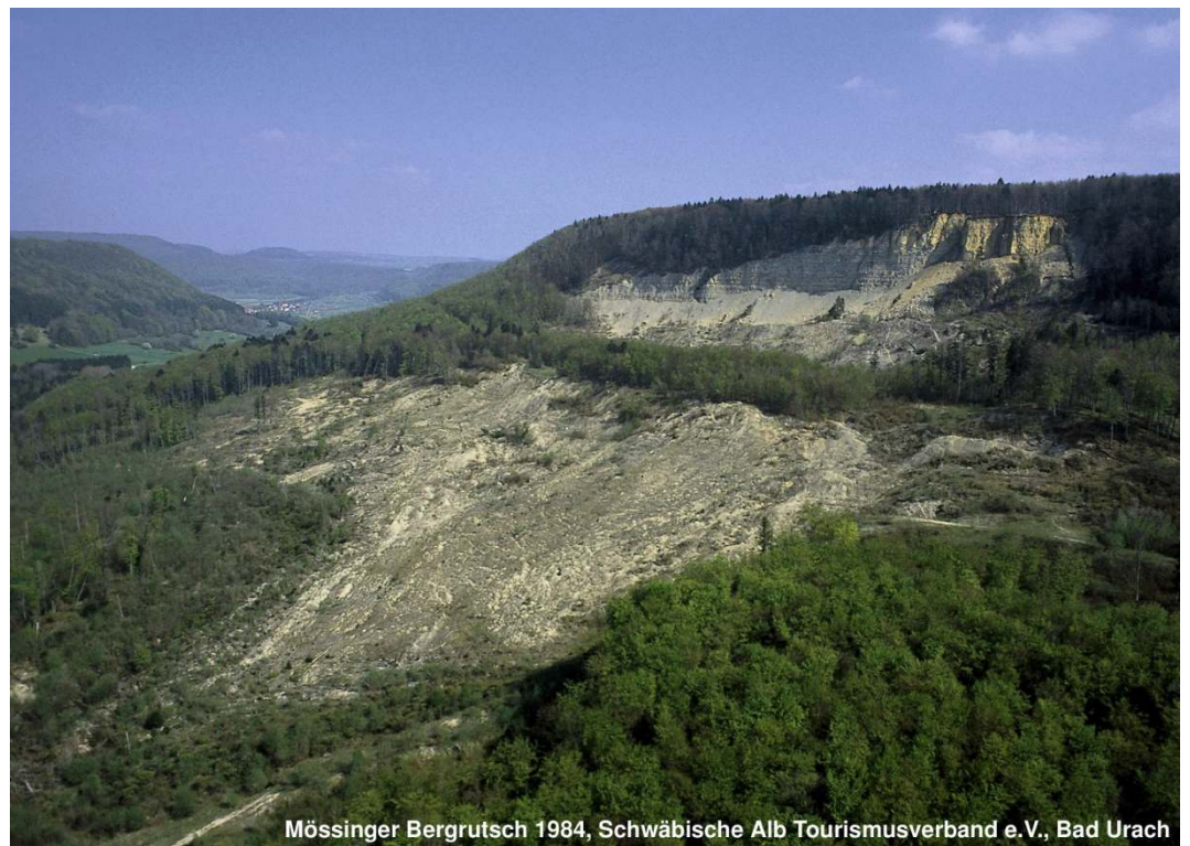
Mössinger Bergrutsch 1984

„Nationaler Geotop“ Mössinger Bergrutsch Damals und Heute